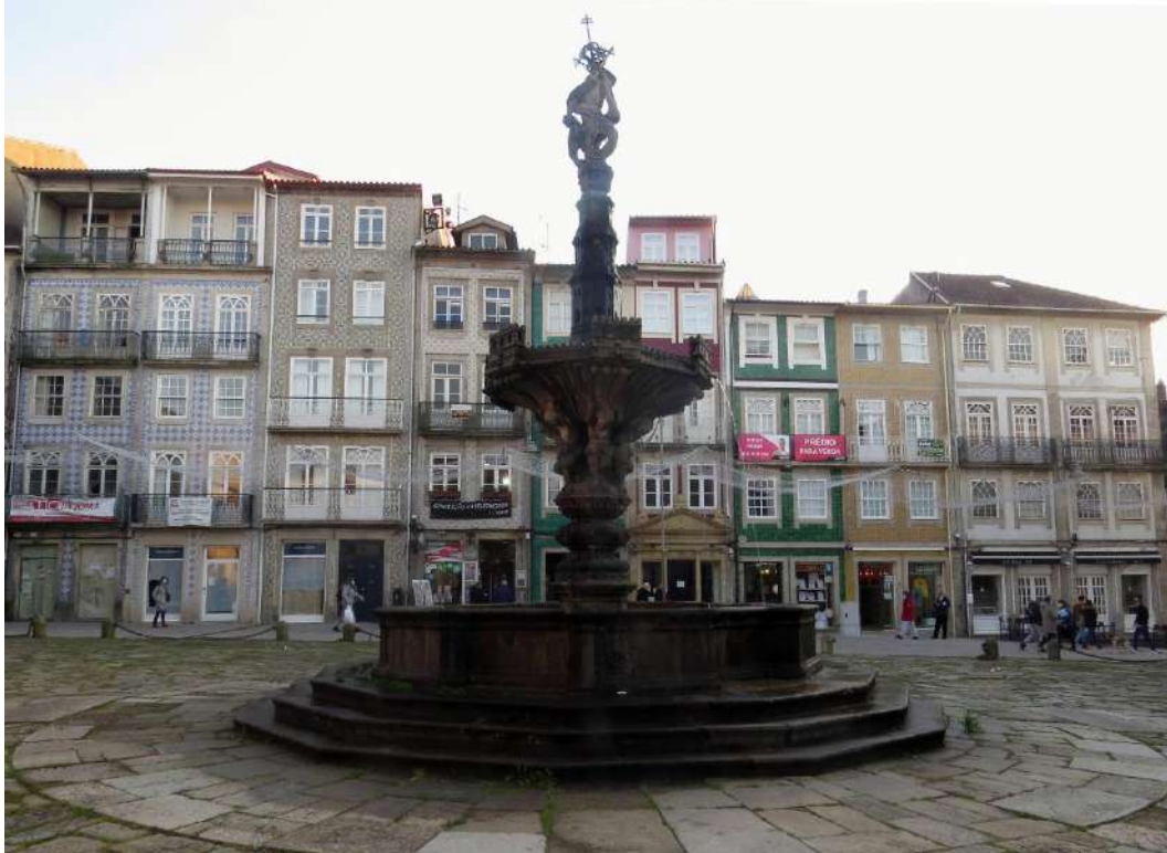
Largo do Paço, foto de cima Fonte dos Castelos vista poente. Foto de baixo, Fonte dos Castelos vista sul.