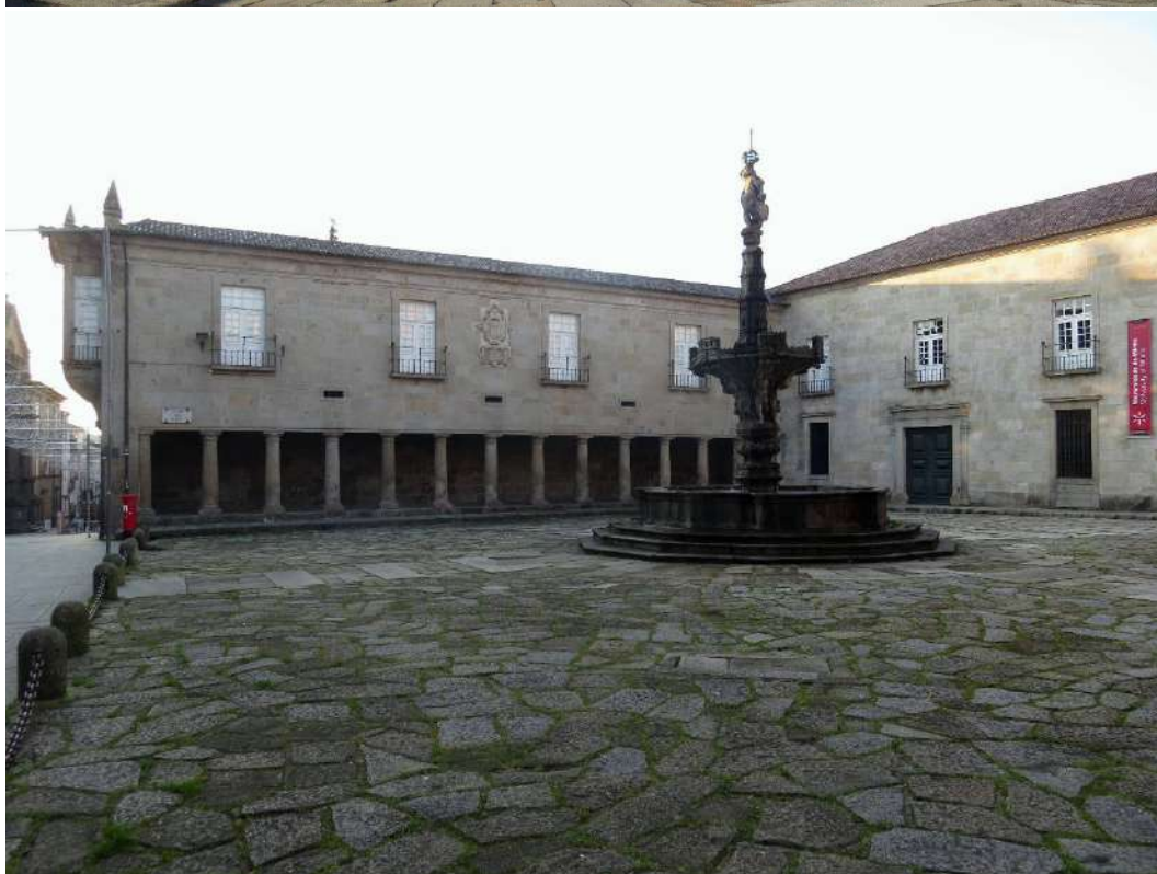
Largo do Paço, foto de cima Fonte dos Castelos vista nordeste. Foto de baixo, Fonte dos Castelos vista noroeste.