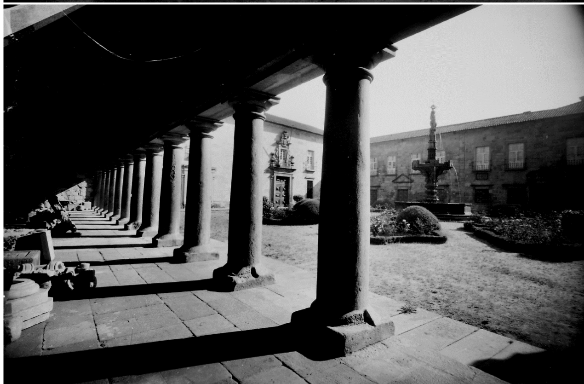
Largo do Paço, foto de cima: O Chafariz dos Castelos, sendo visíveis os Marcos Milários Romanos e parte do muro e gradeamento que fechava a praça. Foto de baixo: Largo do Paço e Fonte dos Castelos visto da galeria de Frei Agostinho de Jesus.