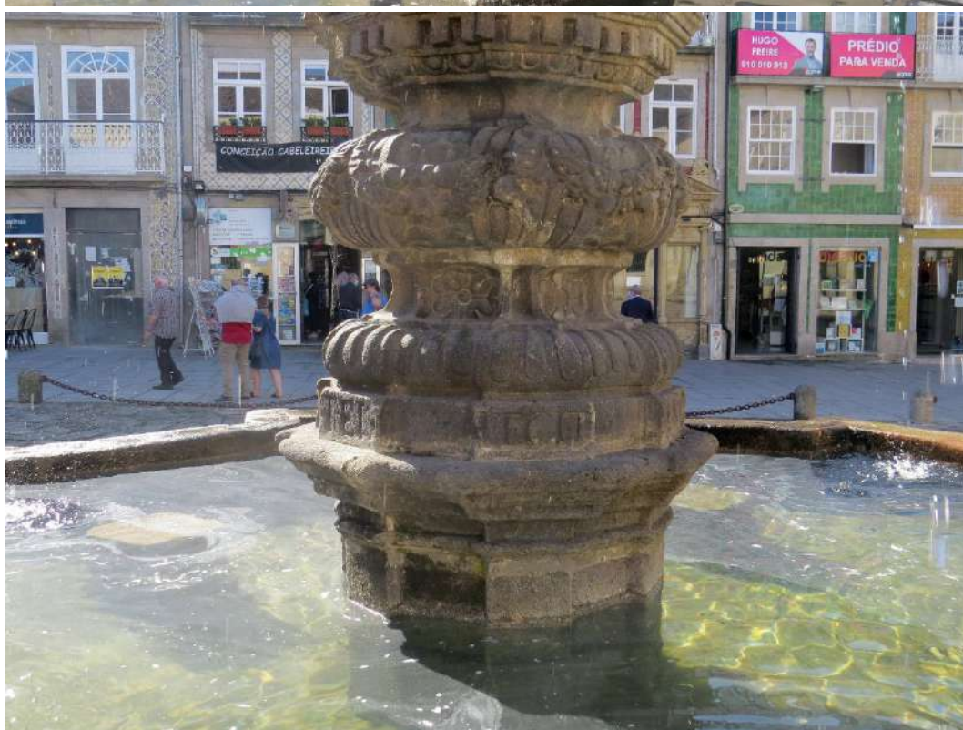
Fonte dos Castelos, pormenor da coluna, onde se vê a inscrição: TELL. e FECIT.