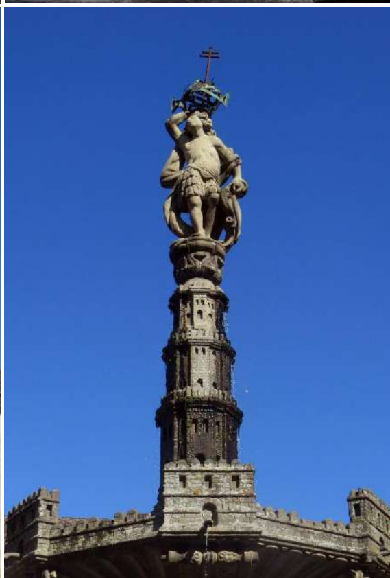
Fonte dos Castelos, vários pormenores.