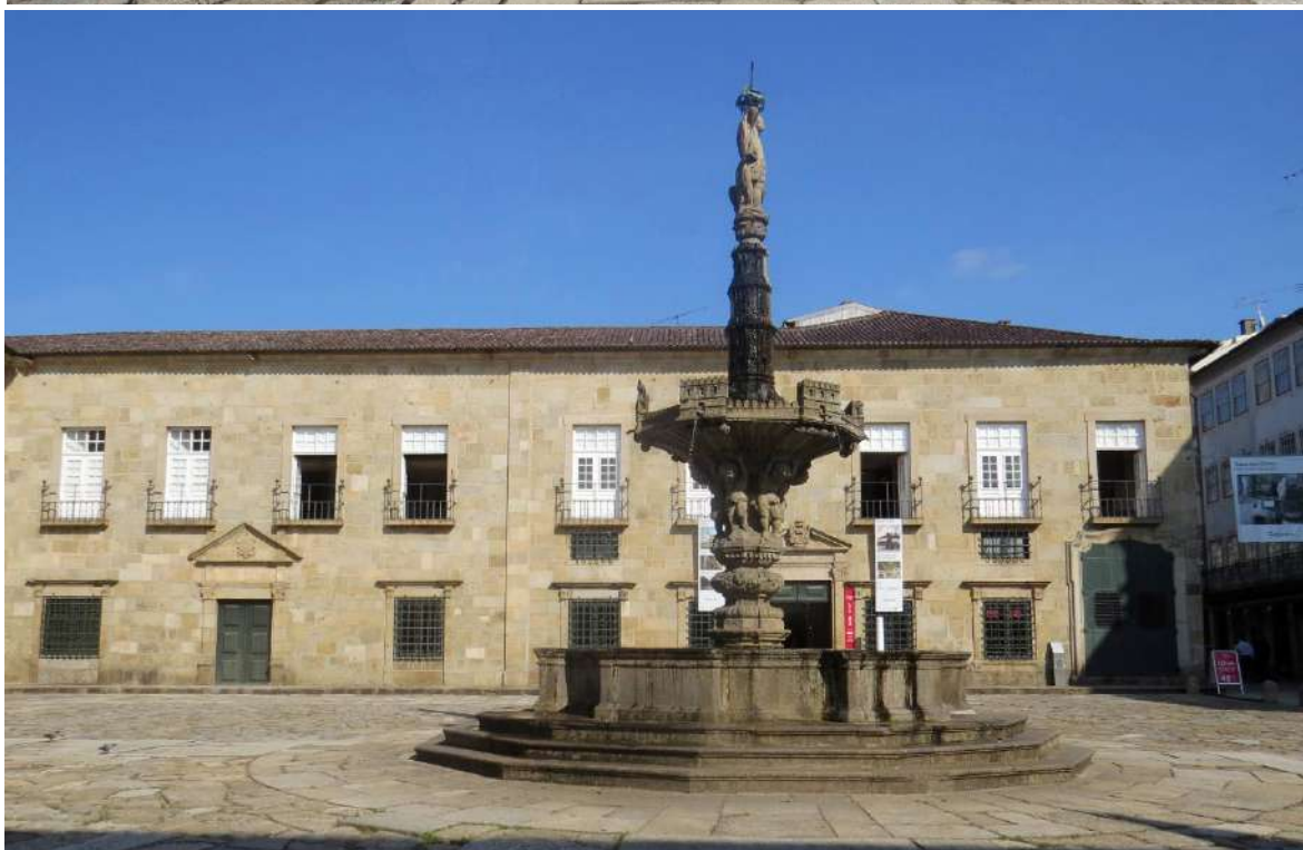
Largo do Paço, foto de cima Fonte dos Castelos vista norte. Foto de baixo, Fonte dos Castelos vista nascente.