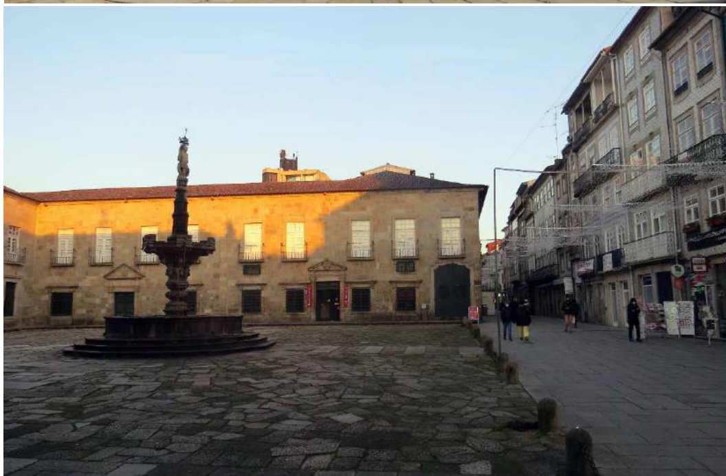
Largo do Paço, foto de cima Fonte dos Castelos vista sudeste. Foto de baixo, Fonte dos Castelos e vista parcial da Rua de Souto.