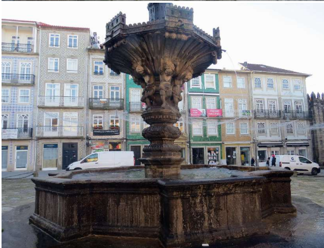
Fonte dos Castelos, pormenor do tanque, coluna e taça.