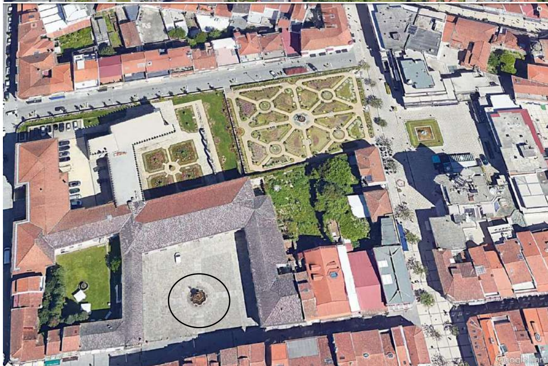
Vista aérea do Largo do Paço com imóvel assinalado. Imagens Google Earth de 22-11-2022.