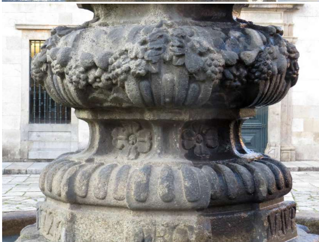
Fonte dos Castelos, pormenor da coluna, onde se vê a inscrição: ANNO 1723 e a decoração da coluna.