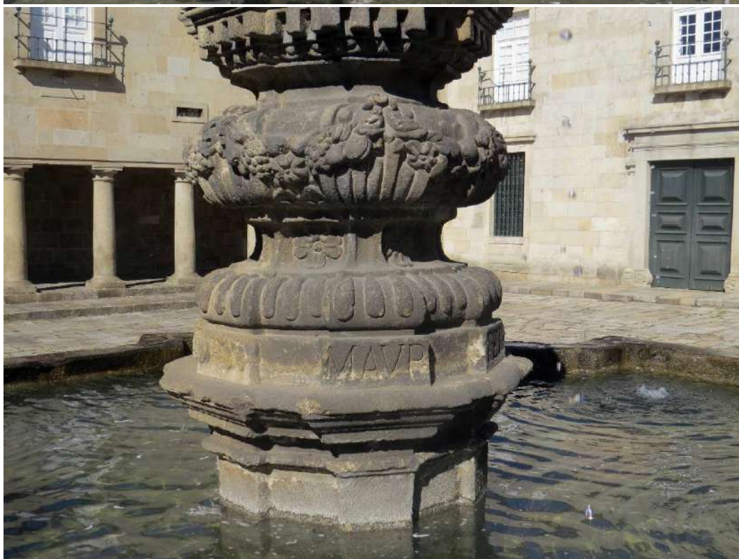
Fontes dos Castelos, pormenor da coluna, onde se vê parte da inscrição: D D. ROD. e MAUR.