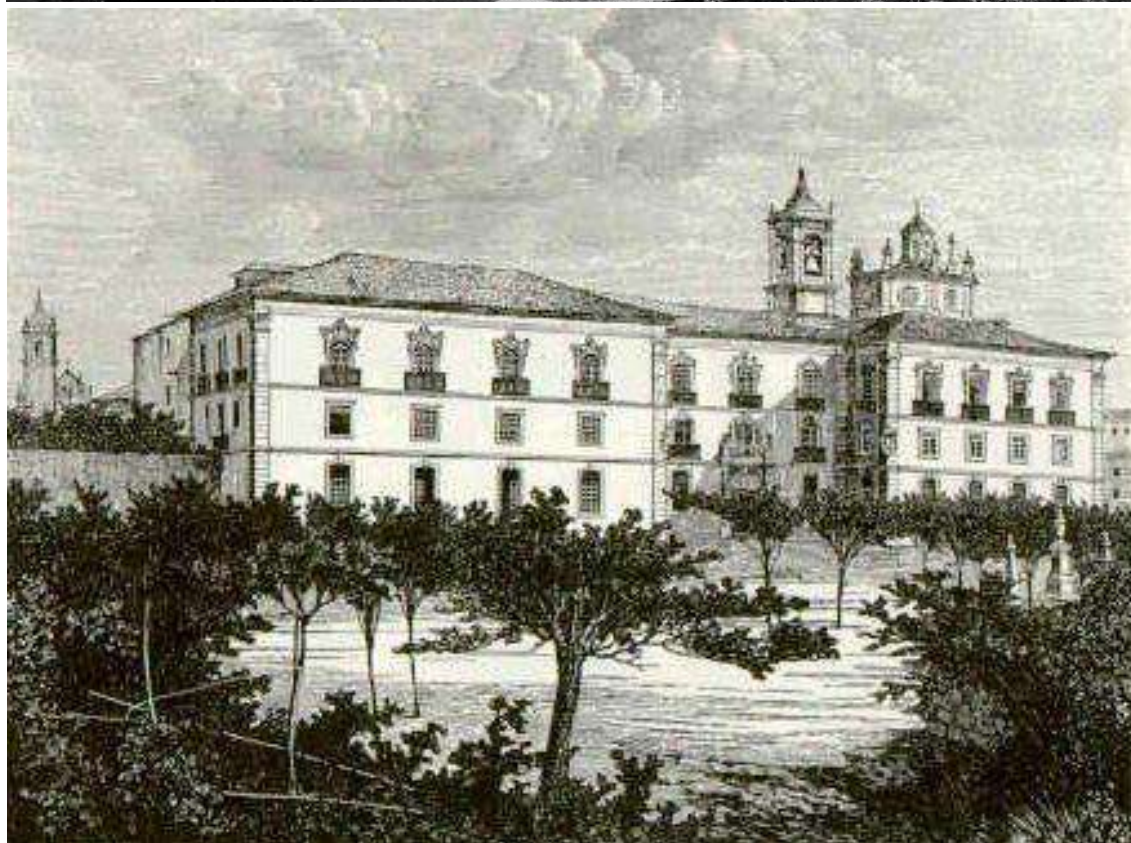
Paço Arquebiscopal: Foto de cima, edifício Medieval, vista do Jardim de Santa Bárbara. Foto de baixo: gravura de 1863, representando o edifício Barroco, fotografias de autor desconhecido retiradas do Grupo Memórias de Braga - Roteiro Histórico e Monumental.