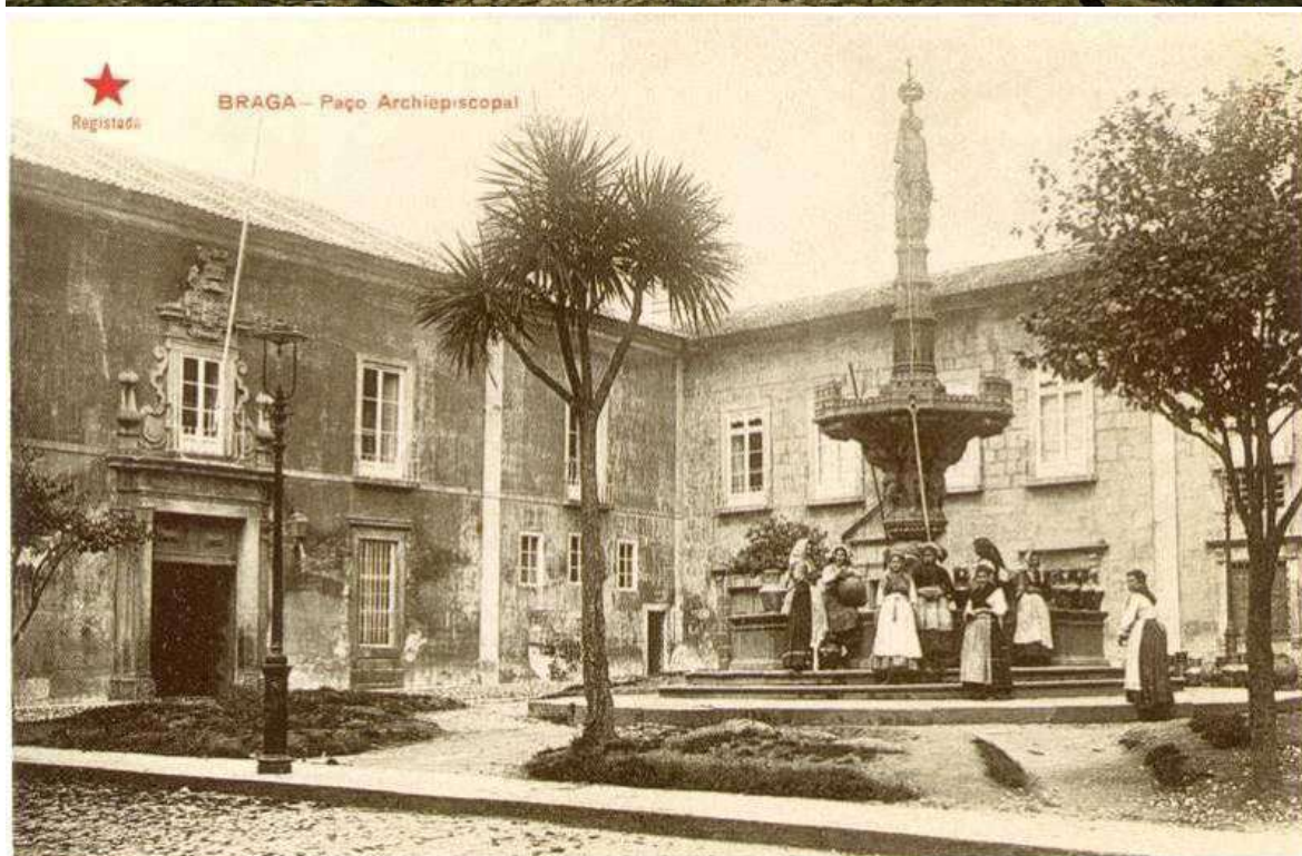
Largo do Paço, praça ajardinada com jardim e árvores e a Fonte dos Castelos, ao centro, fotografias de autor desconhecido retiradas do Grupo Memórias de Braga - Roteiro Histórico e Monumental.