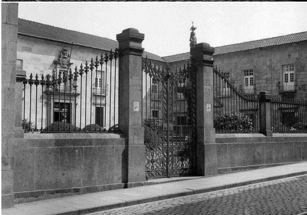
Largo do Paço: vista da Rua do Souto, ostentando o muro e gradeamento que fechava a praça, fotografias de autor desconhecido retiradas do Grupo Memórias de Braga - Roteiro Histórico e Monumental.